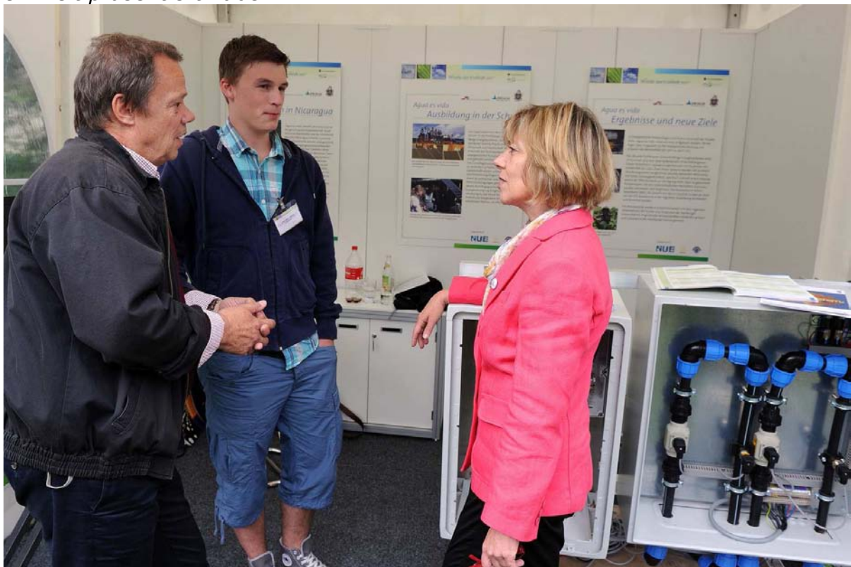
Daniela Schadt im Gespräch