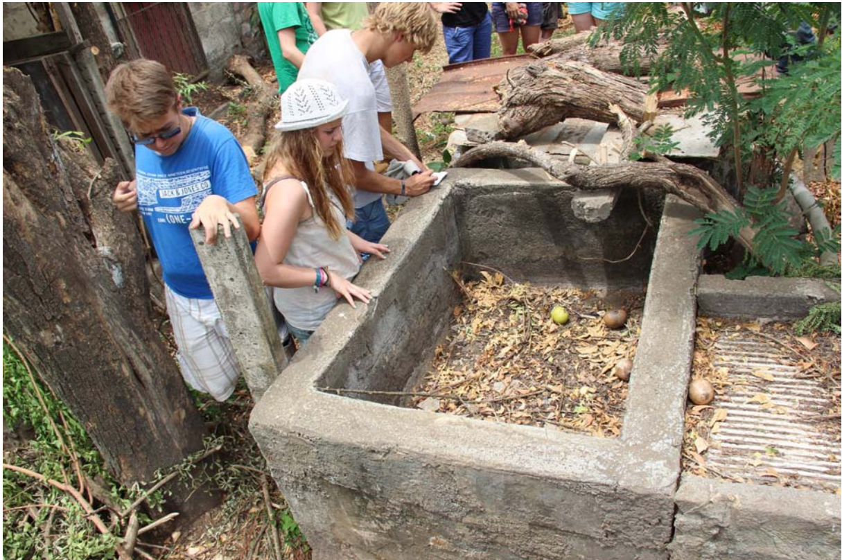
Noch skeptische Blicke: Hier soll einmal die Pumpanlage stehen!