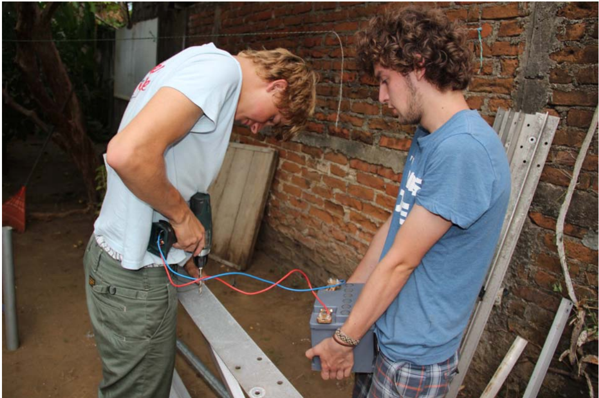
Eine etwas unkonventionelle Art zu bohren!