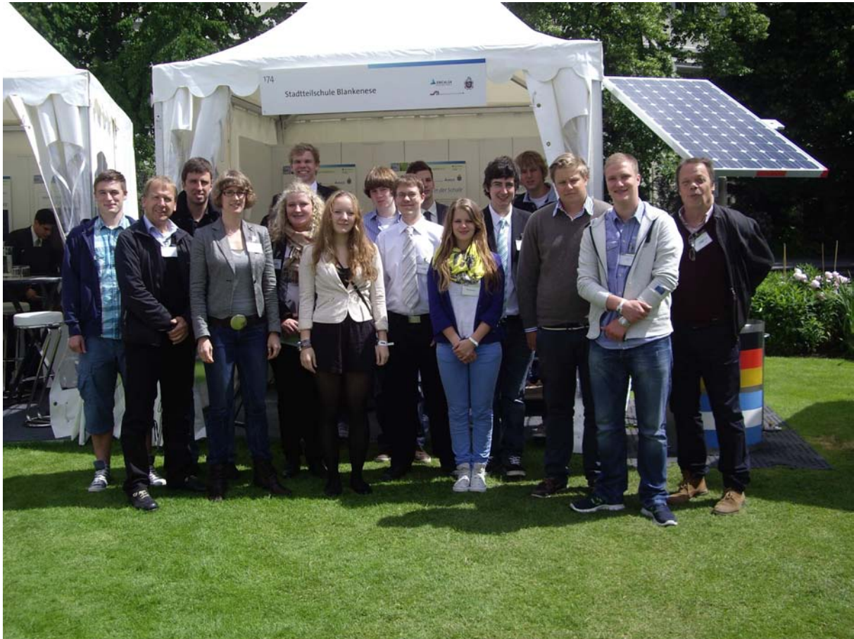
Die Stadtteilschule Blankenese zählte mit dem Projekt "Agua es vida" zu den rund 200 Ausstellern, die sich am 5. und 6. Juni 2012 auf der vierten Woche der Umwelt präsentiert haben.