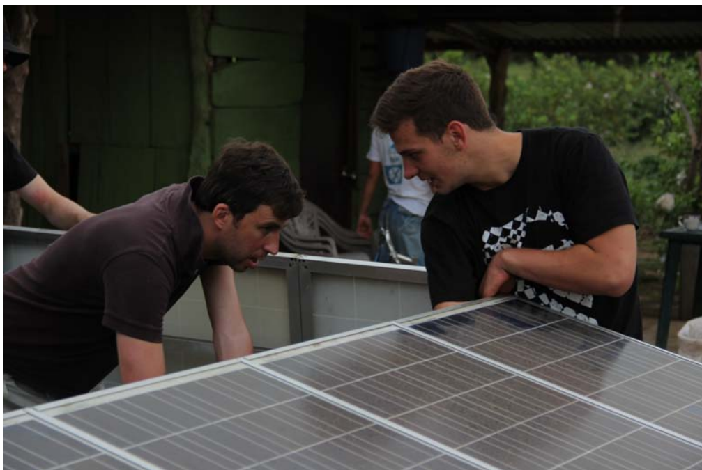
...und hält den prüfenden Blicken stand. ..