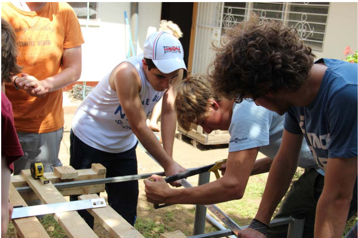
Das Trägergestell nimmt Formen an. Die vorbereitenden Arbeiten werden in den Firma „Enicalsa“ gemacht.