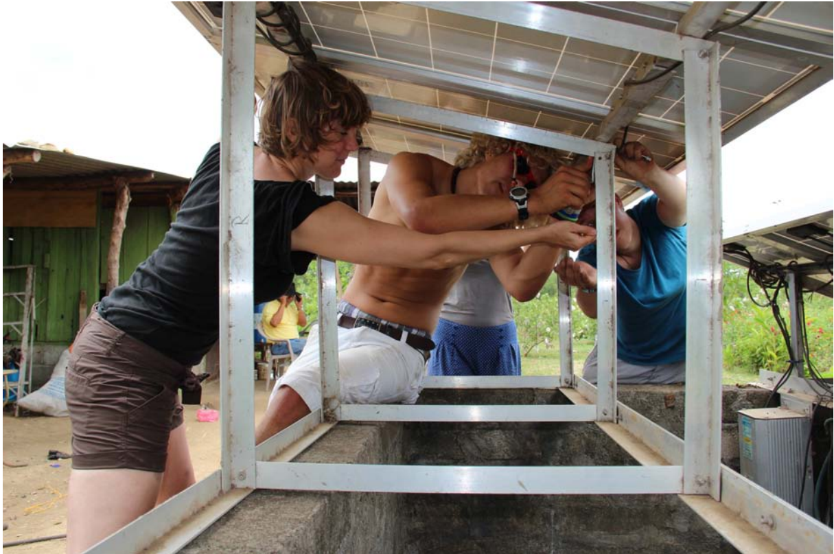
Die Arbeit beginnt...

angepasst wurde. Anschließend wurde die Gesamthöhe der ersten Modulreihe vermessen. Danach wurden die Streben der hinteren Modulreihe den Maßen der ersten Modulreihe nach angepasst, damit sie eine ebene Fläche mit gleichem Winkel ergeben. Zuletzt wurden die Halterungen mit Schrauben neu am Brunnenrand verankert.